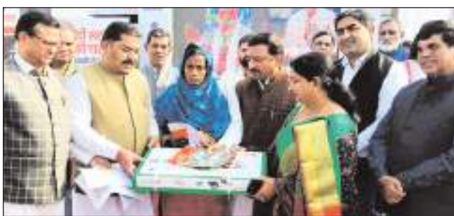
कोई नहीं था। गरीब परिवारों का चूल्हा धुंआ रहित हो, इसके लिए सरकार ने प्रधानमंत्री उज्वला योजना के तहत गरीब परिवार की महिलाओं को मुफ्त में रसोई गैस कनेक्शन दिए हैं। उन्होंने कहा कि अब हरियाणा में एक लाख 80 हजार रुपये से कम आय वाले परिवार की बेटी को कॉलेजों में मुफ्त शिक्षा दी जाएगी है। ऐसे गरीब परिवार

विकसित भारत जनसंवाद संकल्प यात्रा-इ कार्यक्रम के दौरान नागरिकों को एक साथ मिलकर भारत को विकसित राष्ट्र बनाने की शपथ दिलाई। नागरिकों ने शपथ ली कि 'भारत को 2047 तक आत्मनिर्भर और विकसित राष्ट्र बनाने के सपने को साकार करेंगे। नगर निगम की मेयर रेनु बाला गुप्ता ने विकसित भारत संकल्प यात्रा का उद्देश्य केंद्र व प्रदेश सरकार की योजनाओं का लाभ पहुंचाना कायम करेगा। गांव डबरी में नगर निगम की मेयर रेनु बाला गुप्ता तथा गांव शाहपुर में भाजपा के जिला अध्यक्ष योगेंद्र राणा ने 'विकसित भारत संकल्प यात्रा-जनसंवाद कार्यक्रम के दौरान बतौर मुख्य अतिथि नागरिकों से सीधा संवाद किया। गांव डबरी में मुख्यमंत्री मनोहर लाल के प्रतिनिधि संजय बठला ने